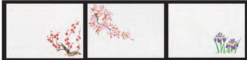
01 (64559) 梅(1月~3月)