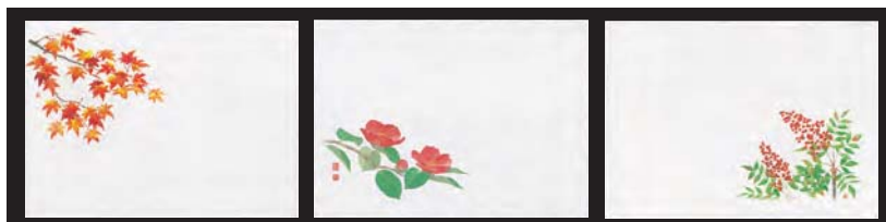
07 (64563) 紅葉(10月~11月)