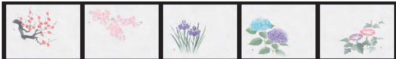
12 (69001) 梅(1月~3月)

少し控えめにお料理を盛り立てます。 四季おりおり、お料理の彩りを 目で楽しむ演出に最適です。