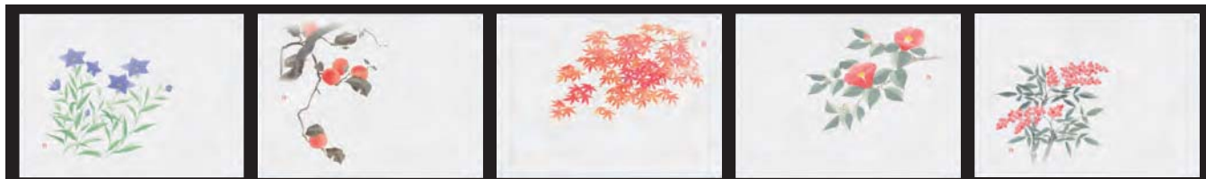
17 (69011) 桔梗(8月~9月)